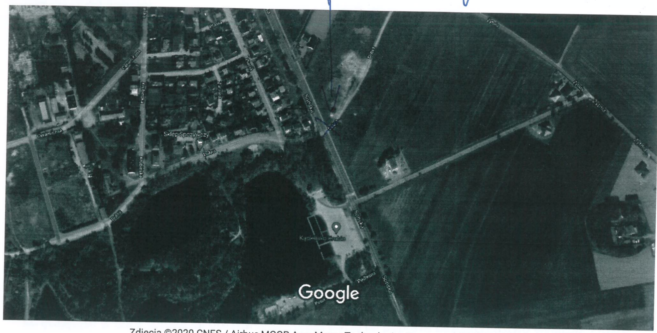
50 m